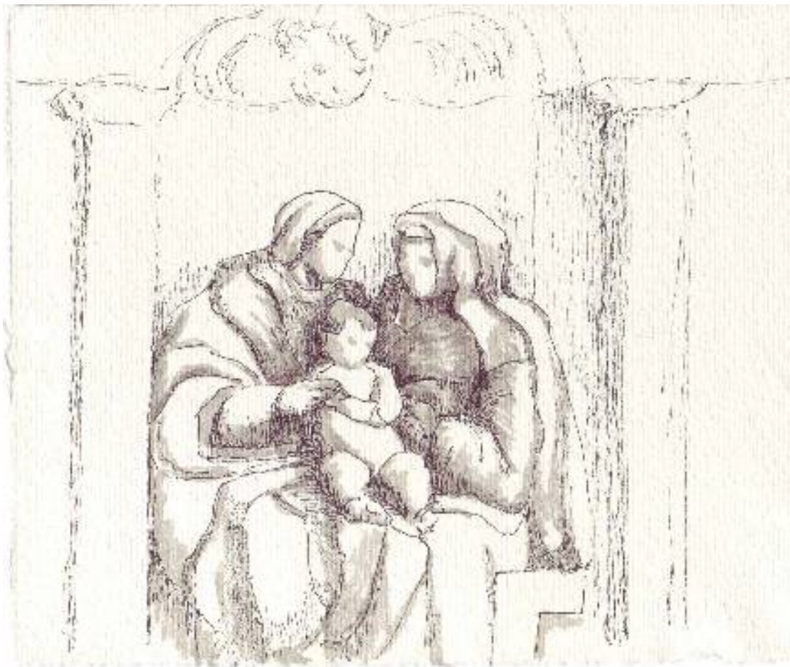
Groupe avec Sainte Anne