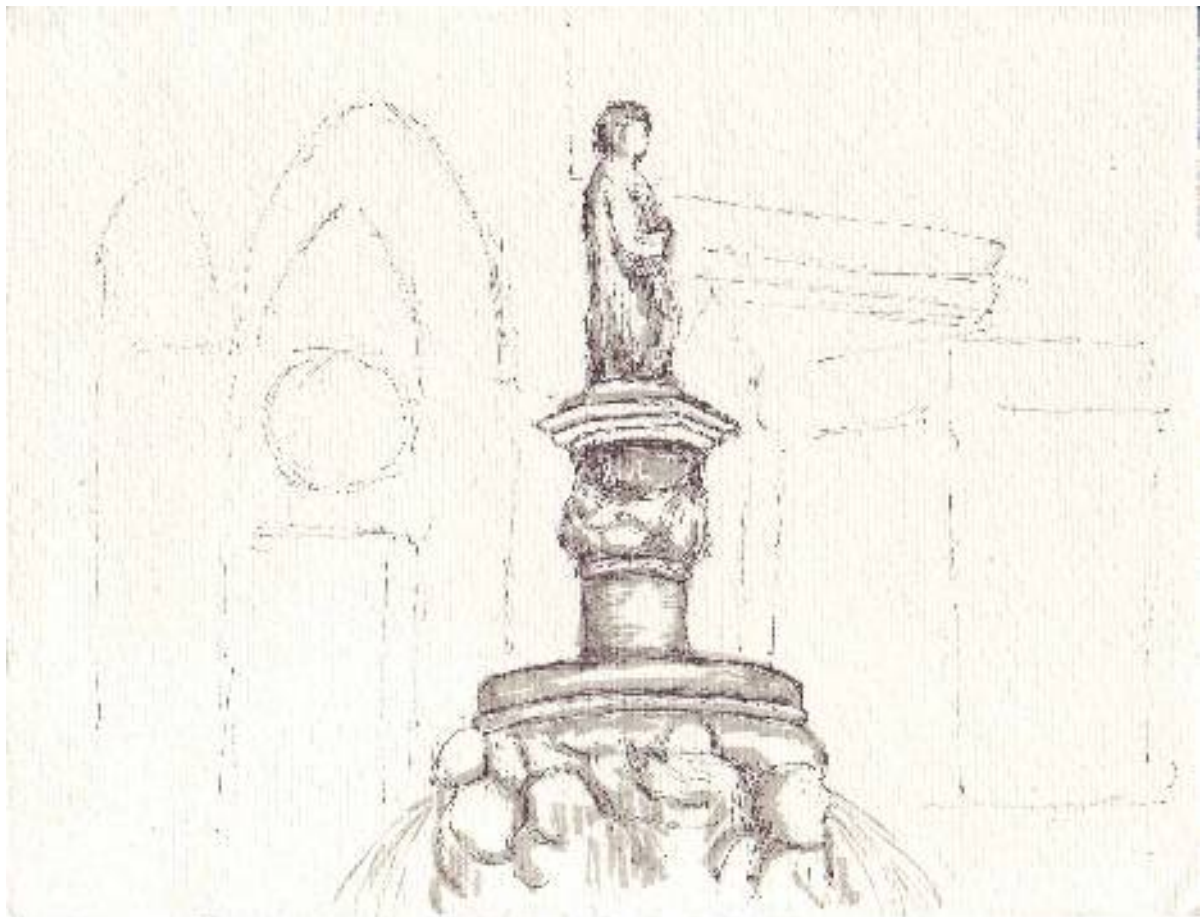
Fontaine devant la Cathédrale

A l'arrivée, la ville nous paraît agréable et verdoyante. Une arrivée un peu sportive, car le bus ne peut entrer dans la vieille ville, et il nous faut grimper une rue pavée en pente, puis des escaliers, en tirant nos bagages. Nous sommes récompensés en haut, découvrant avec bonheur notre hôtel, en face de la magnifique cathédrale, sur une charmante place avec sa fontaine plus une autre église. Il faut dire qu'il y en a 1100 à Burgos !!